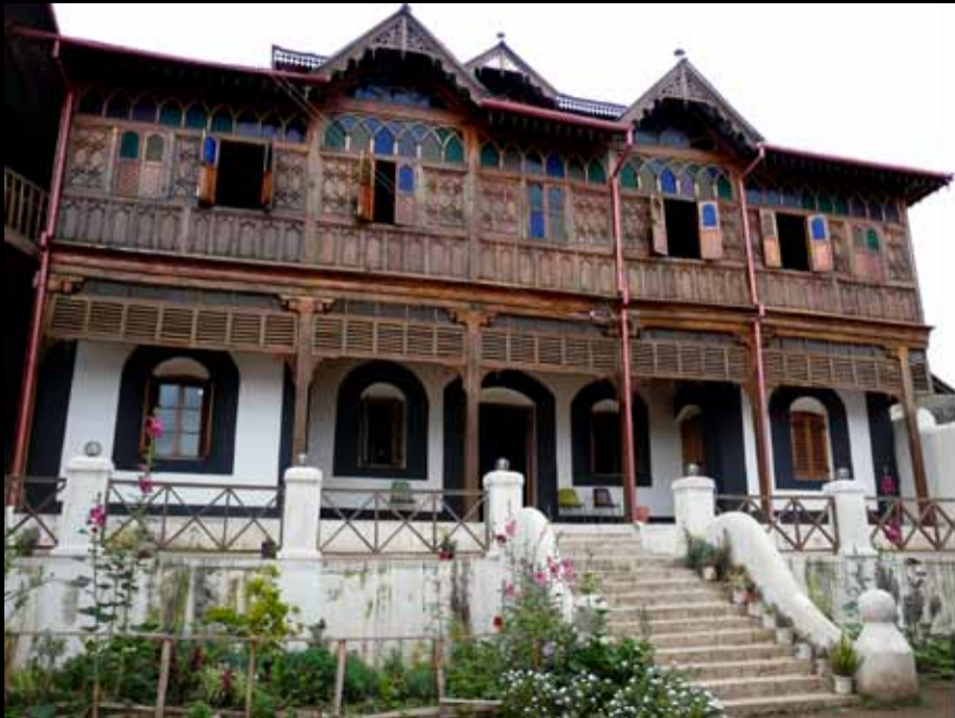
Musée Arthur Rimbaud à Harar, Ethiopie